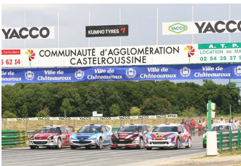
Un départ d'une finale de D1 est un spectacle a ne pas manquer