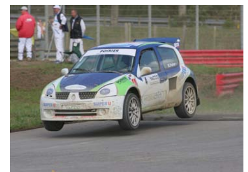
Mickaël Poirier (Clio WRC) sur ses Terres