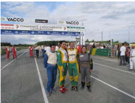
Les drôles de « dames » de la Division 2

Si certains ignorent qu'un titre de Championne de France est attribué en fin de saison, il était bon d'ouvrir cette parenthèse féminine pour rendre hommage à ces dames et demoiselles qui méritent que nous les respections tout autant que les pilotes de la gente masculine.