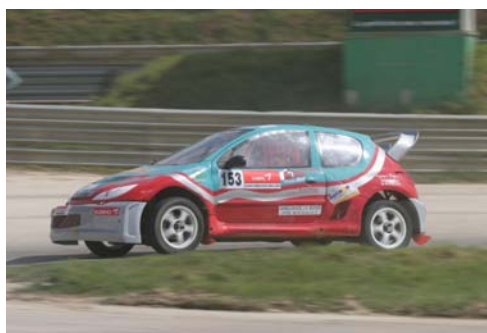
Fabien Frustié (206 T3F)