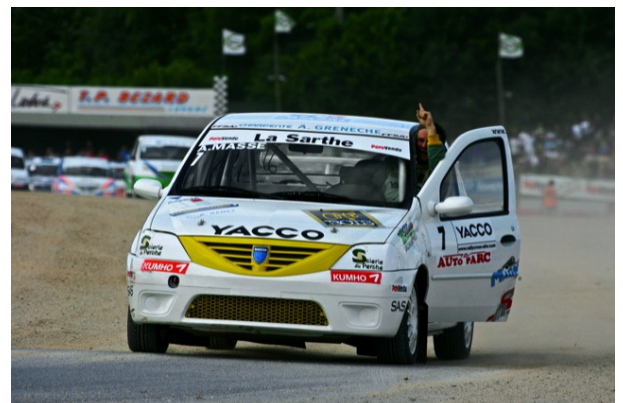
Deux victoires puis une grosse désillusion pour Antoine Massé qui peut encore se battre pour le Trophée